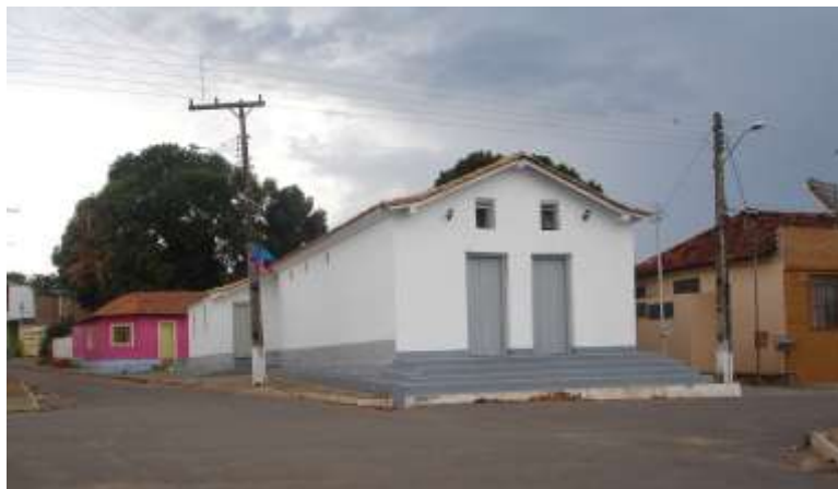
Igreja da Sagrada Família (construída por Joaquim Wolney e Abílio Wolney)

14- Canto da Proclamação do Evangelho escuta Israel e explanação – canto final